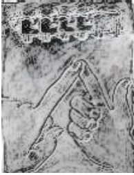
Le plus ancien système consistait à compter sur les doigts. Mais comment enregistrer le résultat ?